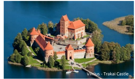
Vilnius - Trakai Castle