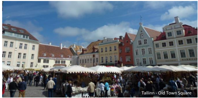
Tallinn - Old Town Square