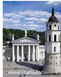
Vilnius - Cathedral